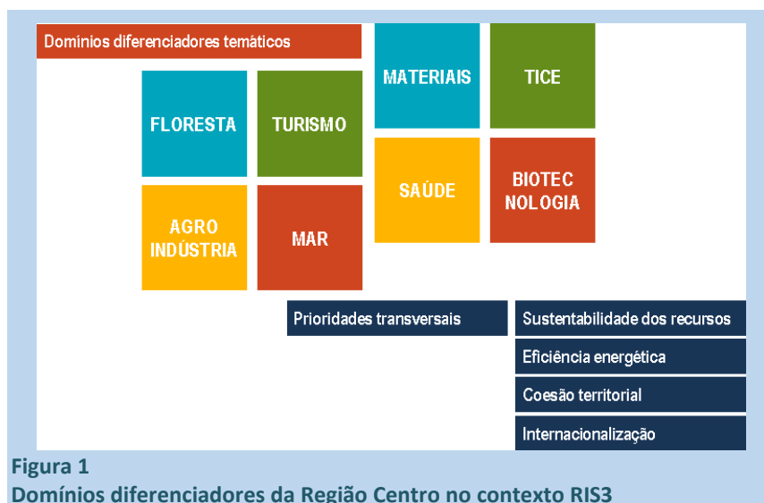
Figura 1 Domínios diferenciadores da Região Centro no contexto RIS3

O processo de auscultação dos agentes regionais conduziu à identificação de mais quatro prioridades transversais, de natureza distinta: a sustentabilidade dos recursos, a eficiência energética, a coesão territorial e a internacionalização. Estas três dimensões são transversais, e correspondem a prioridades da Região Centro que importa considerar em sede de especialização inteligente (figura 1).