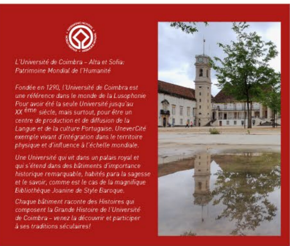
L'Université de Coimbra - Alta et Sofia.