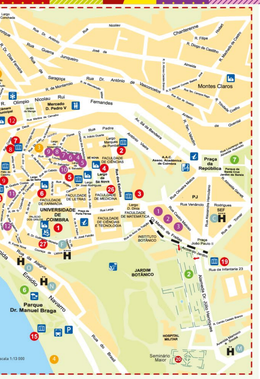
Carte de la Ville COIMBRA